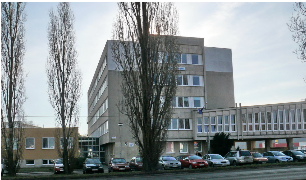
Budova školy, súp.č.3001